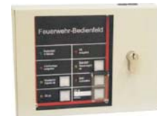
VdS-Nr. G 299034

Feuerwehr-Bedienfeld nach DIN 14661 universell anschaltbar