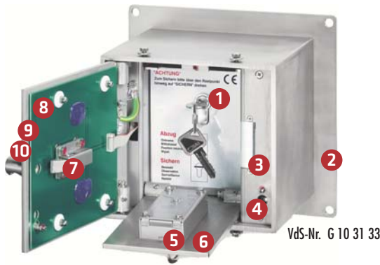
VdS-Nr. G 10 31 33