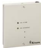
FSD-Adapter 115,00 €