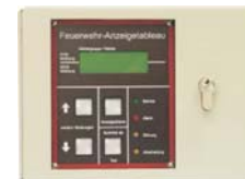
VdS-Nr. G 203086

Feuerwehr-Anzeigetableau nach DIN 14662, universell anschaltbar an Brandmeldezentralen unterschiedlicher Hersteller. Auch in redundanter Ausführung lieferbar!