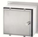
Rundumsabotageschutz FSD Aufpreis: 400,- €